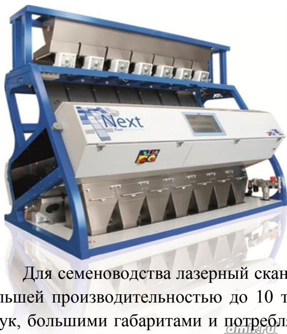
Рис. 2. Фотоэлектронный сепаратор семян высокой производительности (Китай)

Такой китайский сепаратор может быть взят за основу и переделан как лазерный сканирующий сепаратор под производство ПО «Воронежзерномаш».